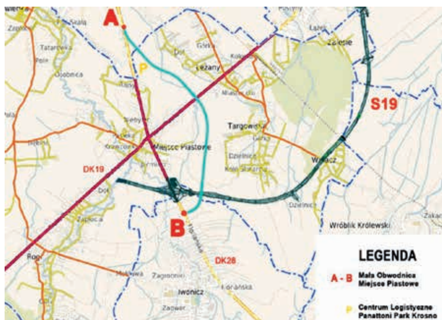
Mała obwodnica – odcinek wyznaczony linią od punktu A do punktu B