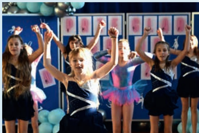
Formacja Dance For Fun – I miejsce (ex aequo) w kat. formacje