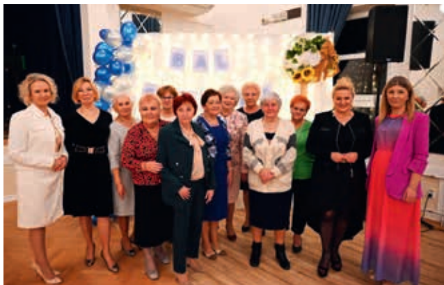
Klub seniora w Głownice