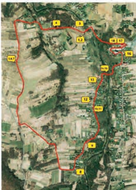
Przebieg ścieżki spacerowo-przyrodniczej