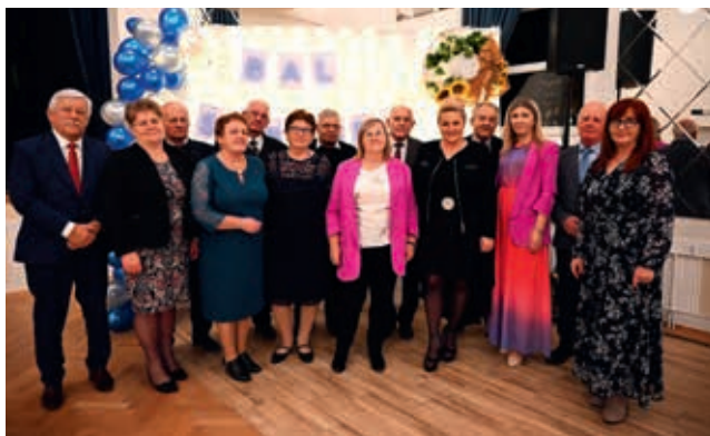
Klub seniora w Targowiskach