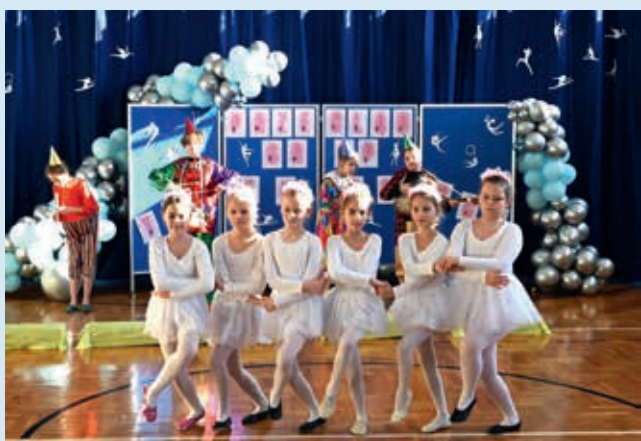
Występ „Laleczka z saskiej porcelany” – I miejsce (ex aequo) w kat. formacje