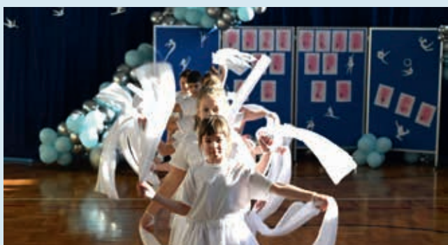
Miejsteckie anioły – II miejsce w kat. formacje