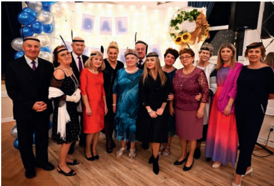
Klub seniora w Łęczanach