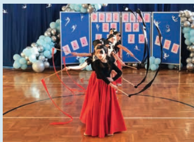
Iskierki – nagroda specjalna w kat. formacje