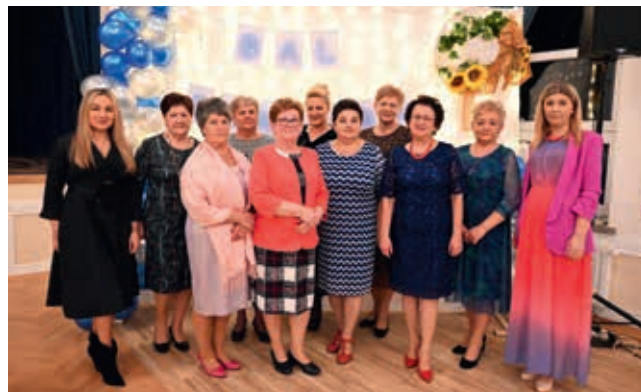
Klub seniora w Rogach