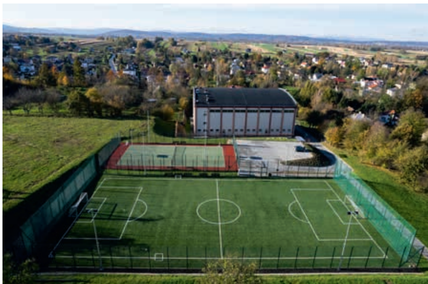
Kompleks boisk w Głowienka

se Piastowe rozkwita” polega na przeprowadzeniu losowania nagród dla osób, które spełniły wymagania formularza PIT. Głównym warunkiem, jaki należy spełnić, aby wziąć udział w loterii, jest m.in. wskazanie gminy Miejsce Piastowe jako miejsca zamieszkania i zgłoszenie się do losowania przez wypełnienie odpowiedniego formularza.