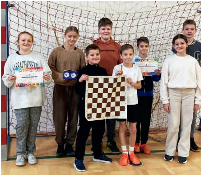
Uczniowie ze szkolnej sekcji szachowej