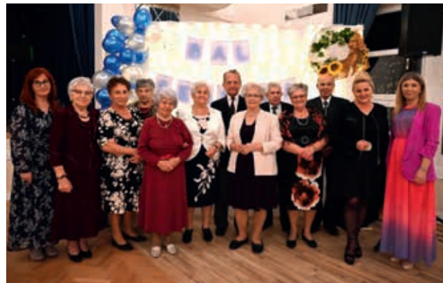
Senior-Wigor we Wrocance