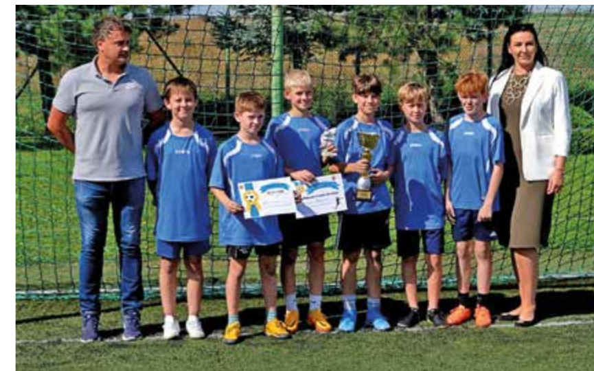
II miejsce – SP Łężany

Tabela końcowa: 1. Miejsce Piastowe; 2. Łężany; 3. Zalesie; 4. Targowiska 5. Głowienka; 6. Rogi; 7. Wrocanka.