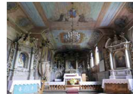
Wnętrze zabytkowego kościoła w Rogach