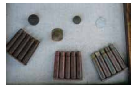
Eksponaty odnalezione na polach w pobliżu Klarowca

przypisać je do żołnierza konkretnej armii. Każdemu poległemu żołnierzowi należy się godny pochówek. Przyswieca nam motto: przypomnieć, upamiętnić i oddać szacunek.