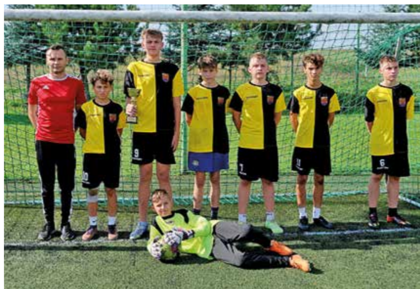
III miejsce – SP Zalesie