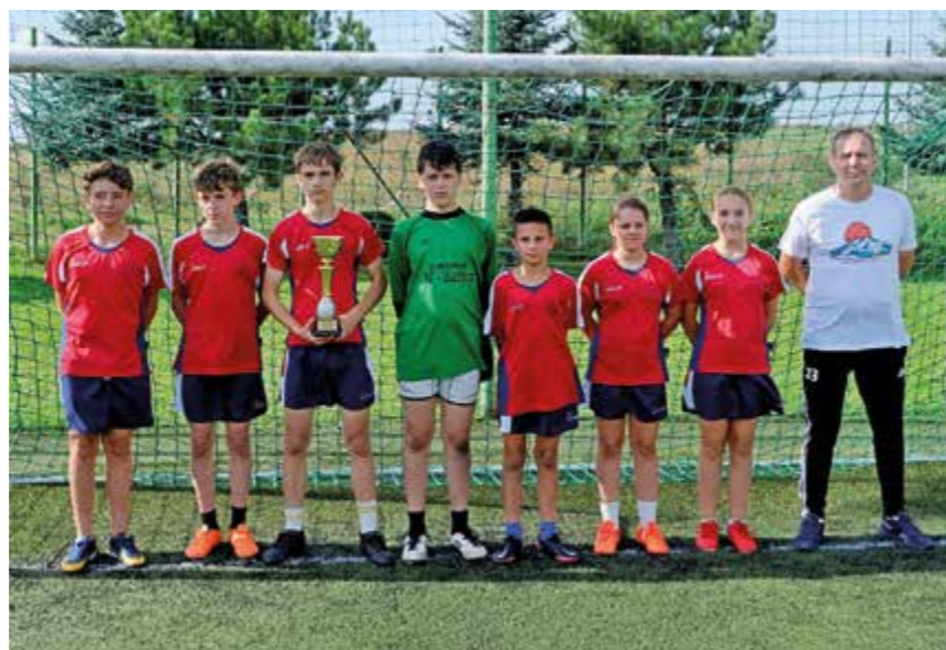
II miejsce – SP Targowiska