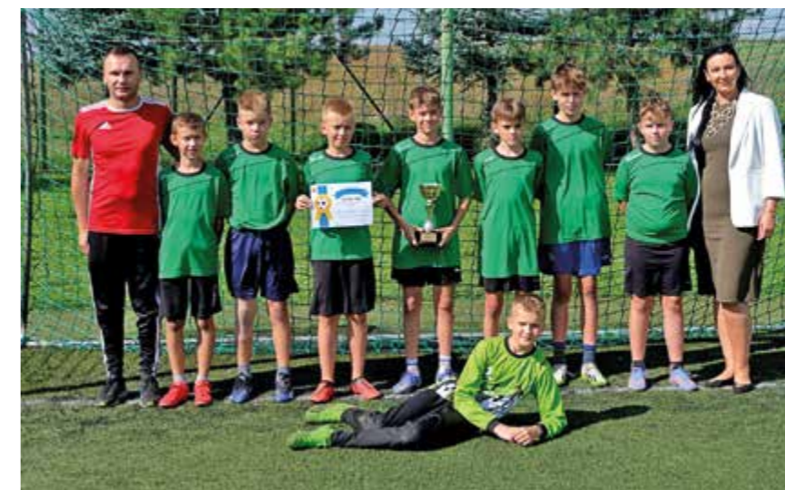
III miejsce – SP Zalesie