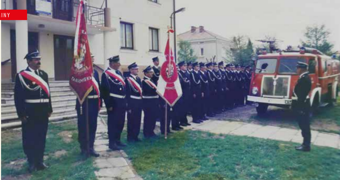
Przekazanie samochodu „STAR-25” z OSP Targowiska do OSP Widacz, 1997 r.