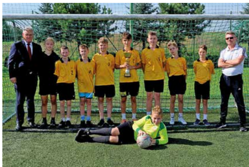
I miejsce – SP Rogi

Tekst: Leszek Zajdel