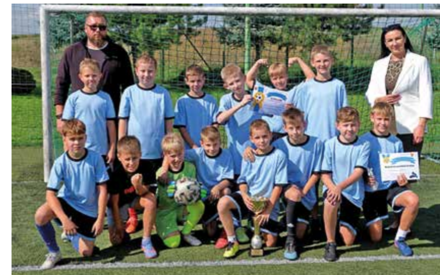
I miejsce – SP Miejsce Piastowe

Turniej rozegrany został w dwóch kategoriach: szkoła podstawowa do VI klasy oraz szkoła podstawowa VII-VIII klasy. Zawody oficjalnie otworzyła wójt Dorota Chilik. Do rozgrywek przystąpiło dwanaście drużyn, co dowodzi ogromnej popularności tej imprezy.