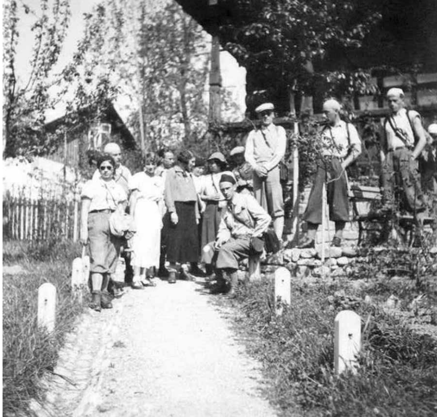
Zjazd geologiczny, 1936 rok.