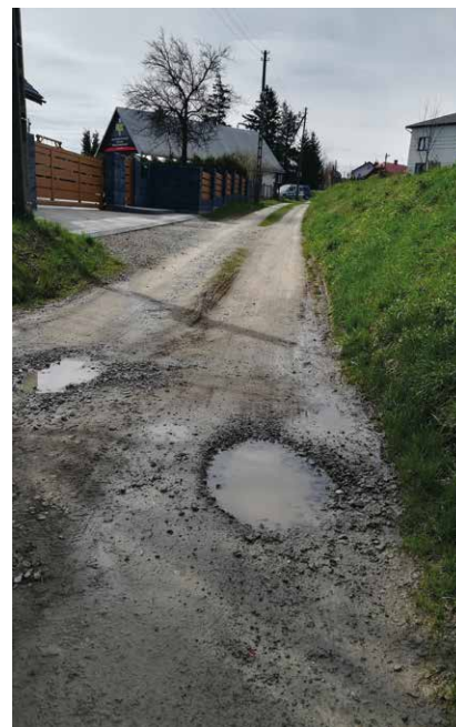
Ulica do remontu w Miejscu Piastowym