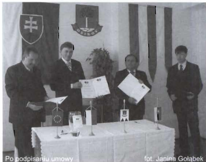
Po podpisaniu umowy