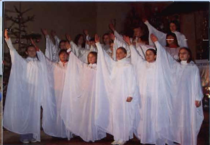
Jest taki wieczór - koncert