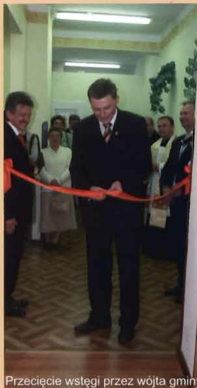
Przecięcie wstęgi przez wójta gminy

W sobotę 19 maja 2007 r. w Zakładzie Rehabilitacji Leczniczej w Miejscu Piastowym oddano do użytku nowo wybudowaną salę kinezyterapii.