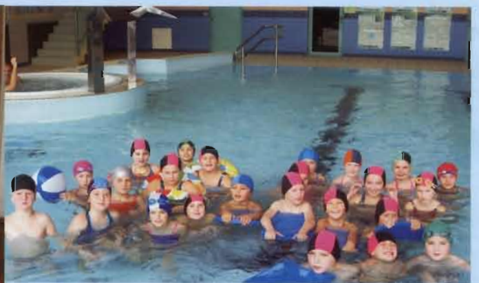
Nauka pływania - basen w Jaśle