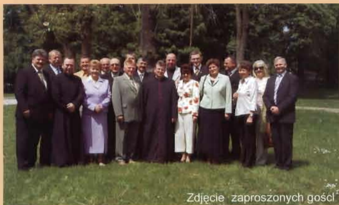
Zdjęcie zaproszonych gości