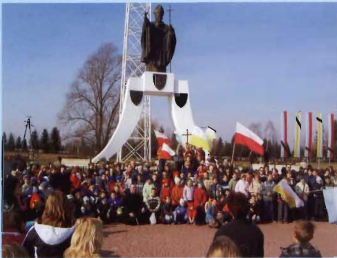
Pielgrzymka pod krzyż papieski