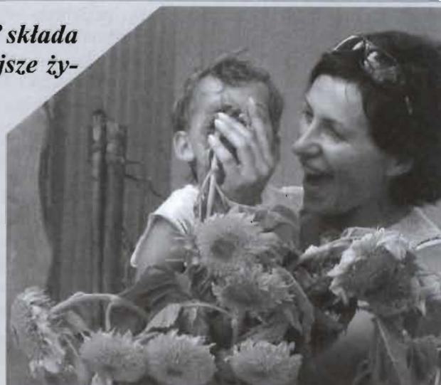
Nasza mama