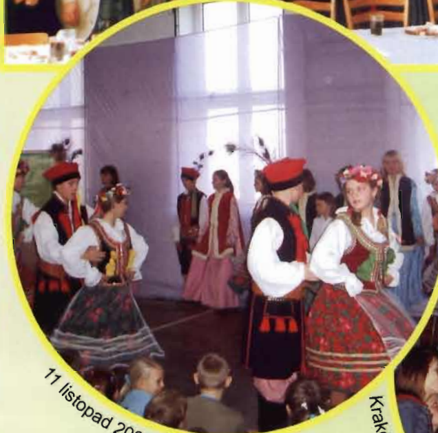
11 listopad 2005