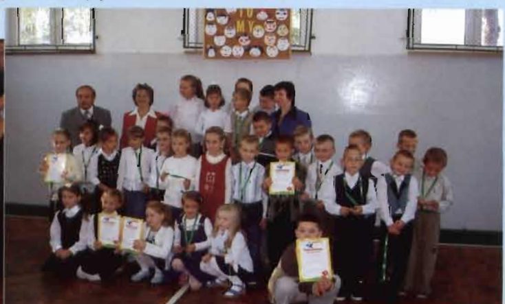
Pasowanie na ucznia