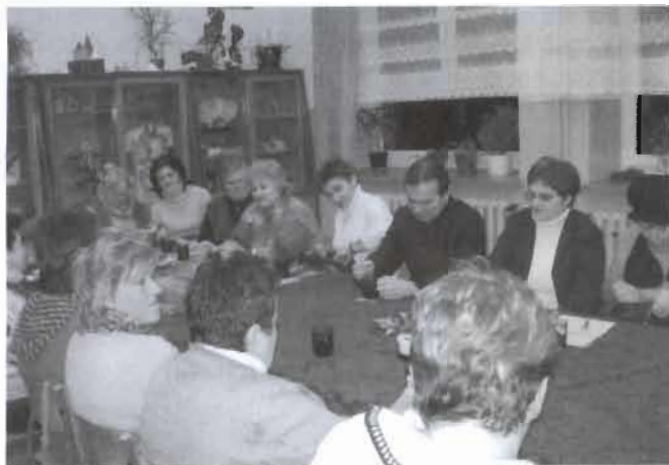
Zebranie założycieli