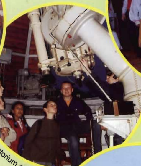
Kraków - obserwatorium astronomiczne