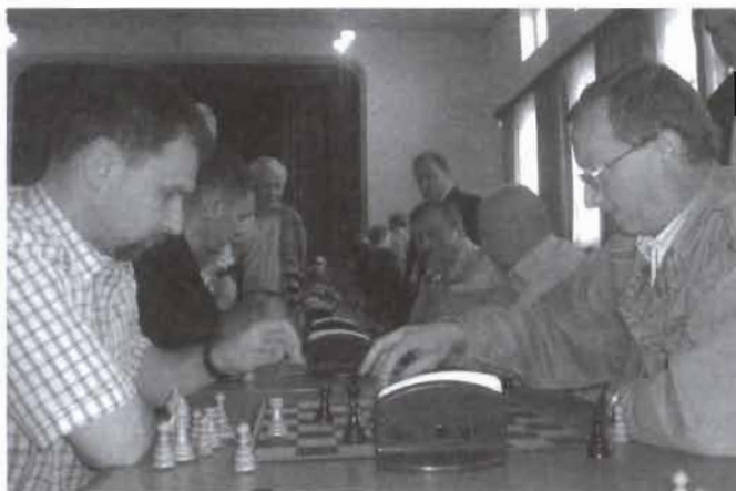
Turniej Szachowy w Rogach

Oto czołówka turnieju: (szczegółowe wyniki znajdują się na internetowej stronie Podkarpackiego Związku Szachowego: www.pkzszach.org )