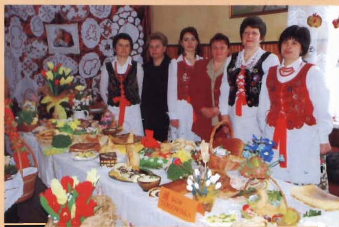
Gospodarze imprezy KGW Targowiska