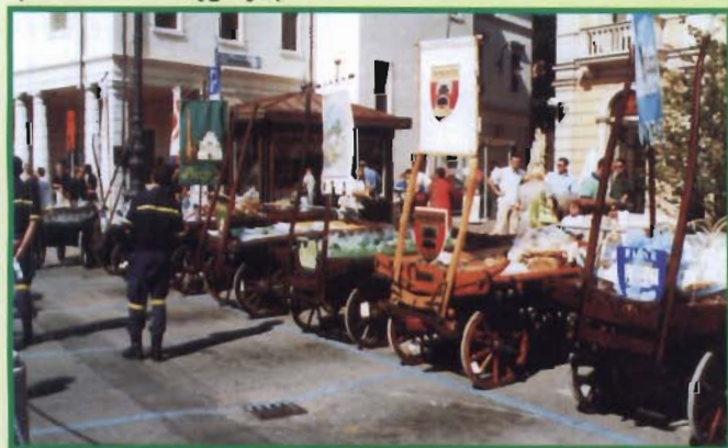
Wozy kupieckie w pełnej krasie