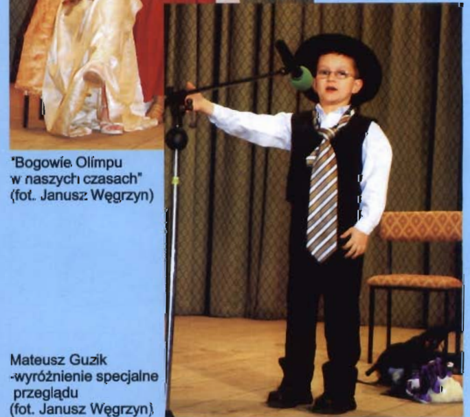
„Bogowie Olimpu w naszych czasach”

z Miejsca Piastowego za program „Bogowie Olimpu w naszych czasach” oraz SP z Wrocanki za prezentację programu „Plotka” J.W.