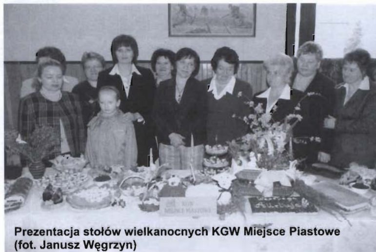
Prezentacja stołów wielkanocnych KGW Miejsce Piastowe