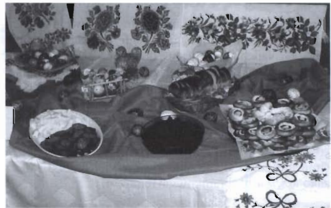
Pokaz stołu słowackiego