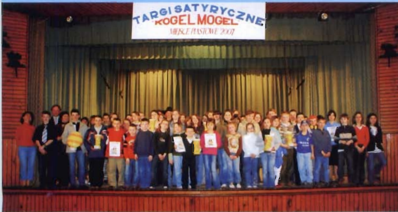
Uczestnicy przeglądu

XIV Targi satyryczne „KOGEL-MOGEL” odbyły się w dniu 30 marca br. w Gminnym Ośrodku Kultury w Miejscu Piastowym. Na gościnnej scenie Domu Kultury zaprezentowały się kabarety, soliści oraz grupy teatralne ze swoimi programami satyrycznymi. Jak sama nazwa wskazuje targi satyryczne to impreza, której głównym celem jest dostarczenie widzom sporej dawki satyry i humoru - takie znamiona miały też wszystkie prezentowane w tym dniu programy.