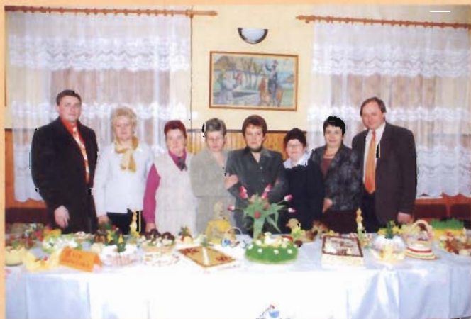
KGW Głowienka