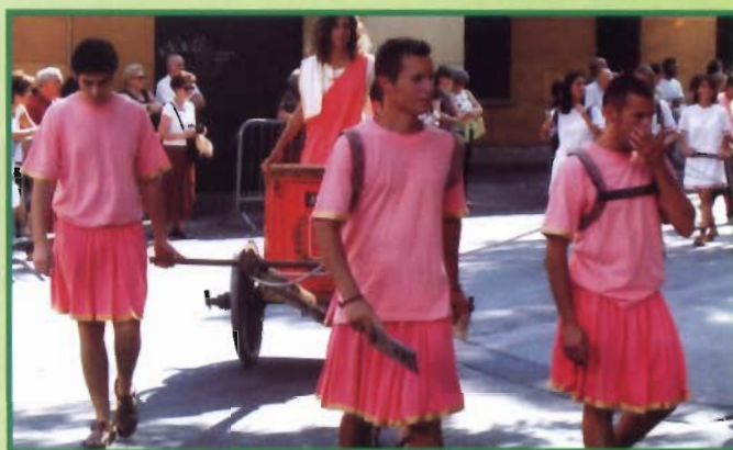
Parada na rynek