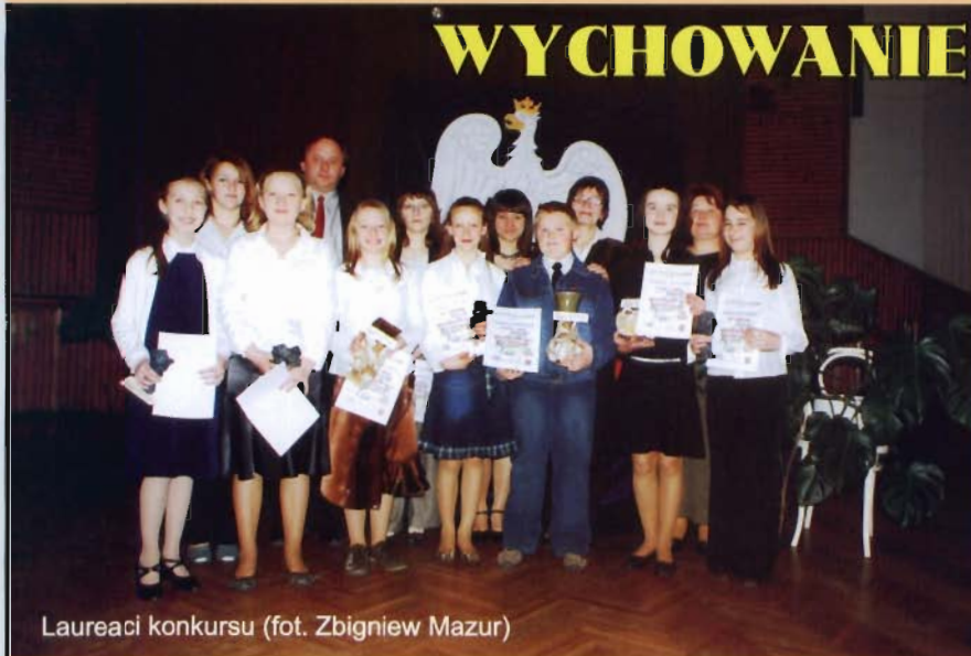
Laureaci konkursu

13 kwietnia 2007 r. w Gminnym Ośrodku Kultury w Miejscu Piastowym odbył się po raz pierwszy gminny etap Konkursu Poezji Patriotycznej, który zorganizowany został przez Starostwo Powiatowe w Krośnie oraz gminy powiatu krośnieńskiego. Celem tego przedsięwzięcia jest przede wszystkim wychowanie patriotyczne młodego pokolenia poprzez upowszechnianie polskiej poezji patriotycznej. W etapie gminnym wzięło udział 16 recytatorów ze szkół podstawowych oraz gimnazjów.