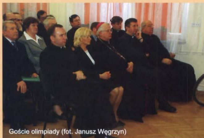
Goście olimpiady