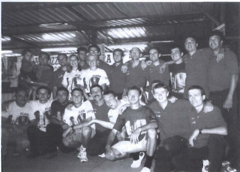
Drużyna Gminy Miejsce Piastowe wraz z mieszkańcami San Gaetano

impieza związana jest ściśle z tradycją miasta. Już kilka stuleci temu kupcy z bliższych i dalszych okolic równinnych z wysiłkiem ciągnęli wozy pełne towarów na dominujące nad miastem wzgórze, na którym usytuowany był targ. Pokonując tę trasę spieszyli się, by zająć jak najbardziej dogodnie dla siebie miejsce. Tyle historia. Dzisiaj sceneria jest nieco inna, ale duch współzawodnictwa w gruncie rzeczy pozostał taki sam. Każdego więc roku w pierwszą niedzielę września dzielnice Montebelluny rywalizują między sobą pchając