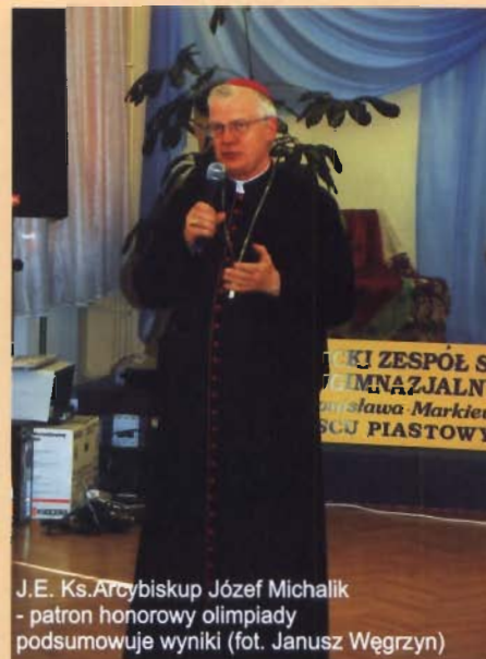
J.E. Ks. Arcybiskup Józef Michałik - patron honorowy olimpiady podsumowuje wyniki