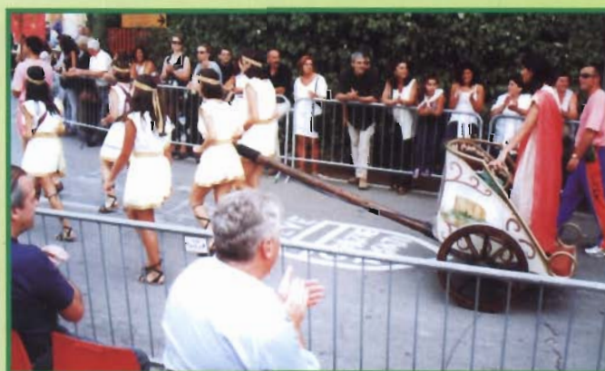
Parada na stary rynek