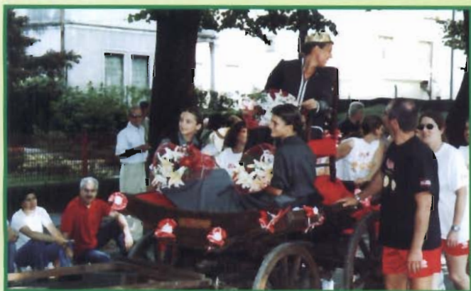
Królowa Il Palio