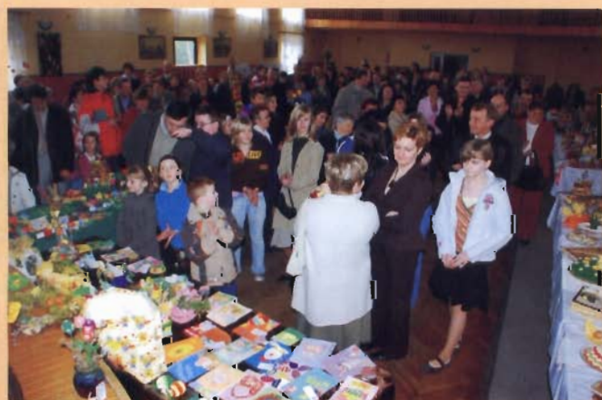
Licznie przybyli mieszkańcy gminy