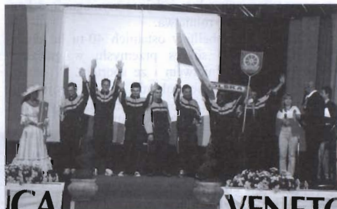
Prezentacja drużyn

W 2002 r. po raz drugi zawodnicy z Miejsca Piastowego uczestniczyli w Europalio, tym razem na zaproszenie nowego burmistrza Montebelluny Laury Puppato. Doświadczenie zdobyte rok wcześniej pozwoliło im na zajęcie lepszej pozycji w klasyfikacji końcowej. Na czas tych zawodów naszemu zespołowi przyporządkowana została dzielnica San Gaetano. Tamtejsi zawodnicy dopingowali polską drużynę towarzysząc jej podczas biegu. Zakończenie zawodów świętowano już razem z mieszkańcami San Gaetano, a przyjaźnie jakie się wówczas nawiązały rozwijały się przez kolejne lata, czego potwierdzeniem może być fakt, że nasze spotkania są kontynuowane pomimo tego, że los czasami przyporządkowuje nam innych opiekunów.