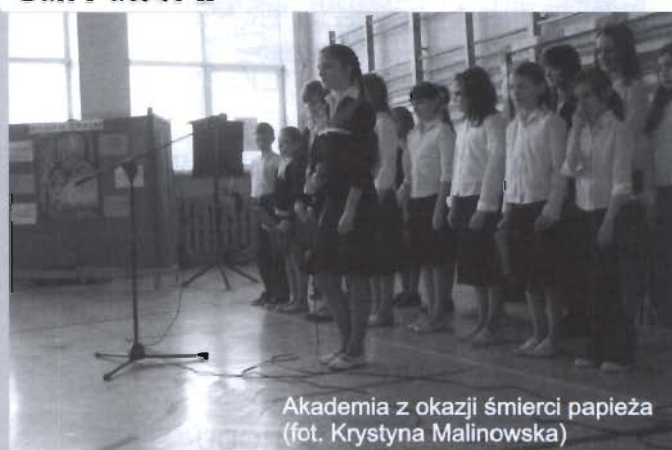
Akademia z okazji śmierci papieża