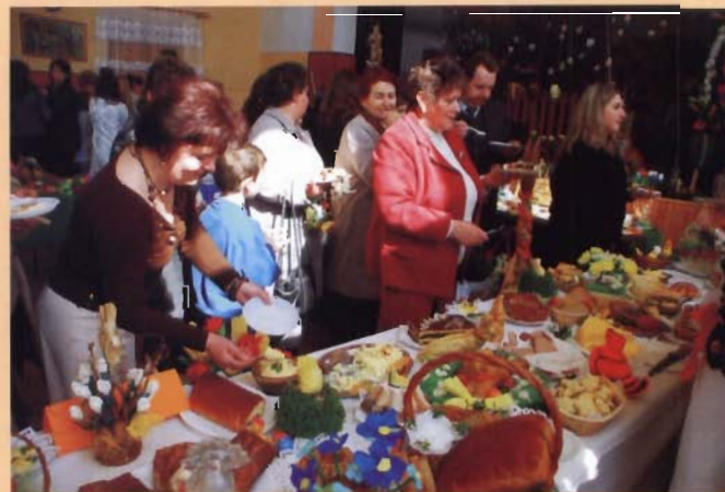
Stół wielkanocny KGW z Targowisk