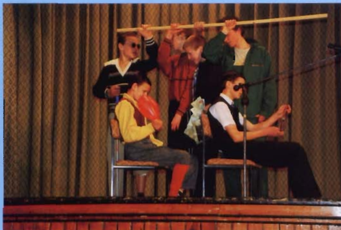
„Autobus” - Grand Prix