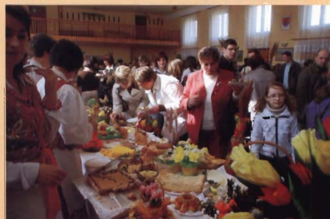
Degustacja potraw