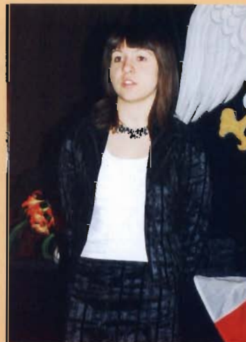
Beata Mercik Gim. Sp. w Targowiskach