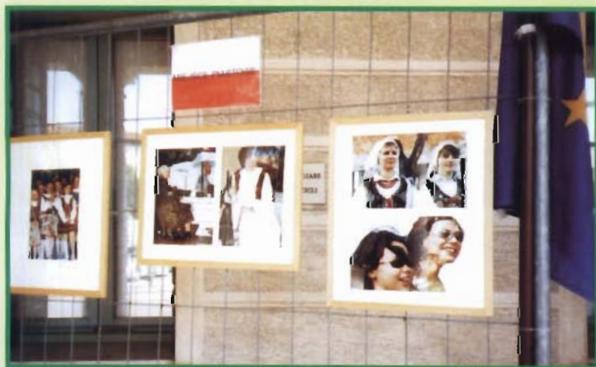
Wystawa fotograficzna „Ja, mieszkaniec Europy”