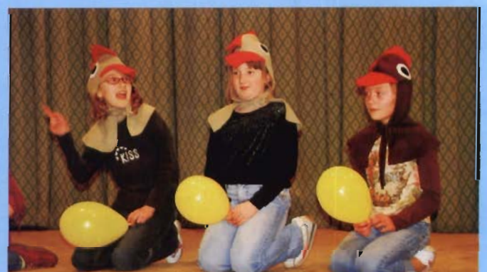
„Plotka” - wyróżnienie