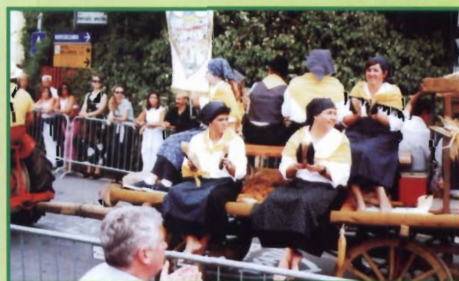
Przemarsz grup na stary rynek