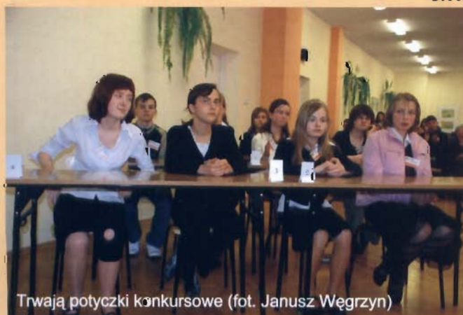
Trwają potyczki konkursowe