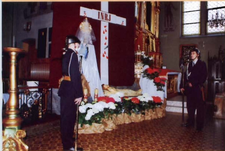
Miejsce Piastowe