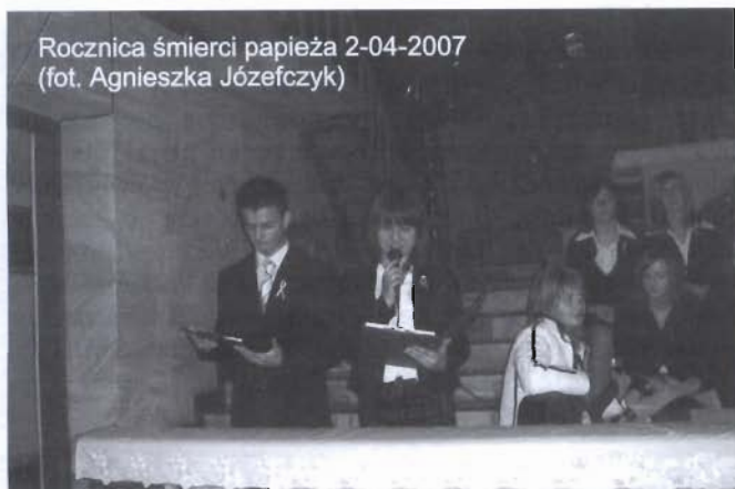
Rocznica śmierci papieża 2-04-2007

Przepelniają nas one nadzieją głoszoną przez Ukochanego Ojca Świętego, że śmierć to nie koniec, lecz początek życia wiecznego.