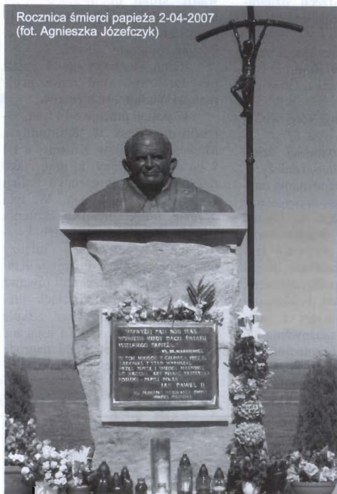
Rocznica śmierci papieża 2-04-2007

„Czas ucieka, wieczność czeka” - taki napis widniał na wadowickim zegarze. Proste cztery słowa, a zawierają w sobie tyle treści i mądrości. Jeszcze mamy świeżo w pamięci te chwile, gdy nasz Ojciec Święty odchodził do „Domu Ojca”, a tu już mija druga rocznica śmierci tego wielkiego Polaka.