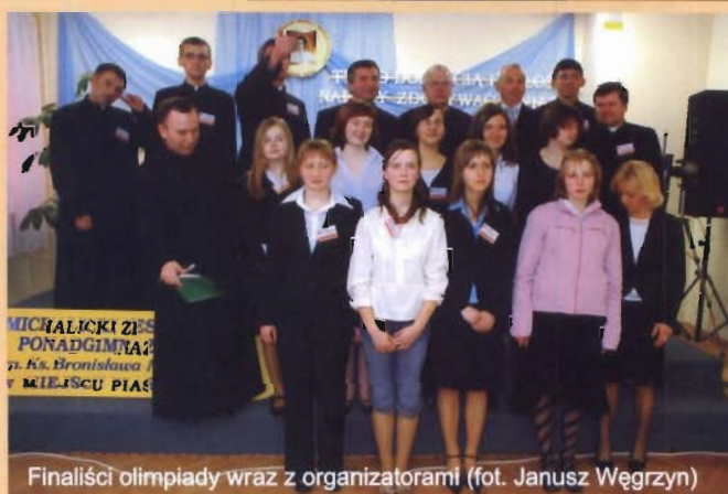
Finałiści olimpiady wraz z organizatorami