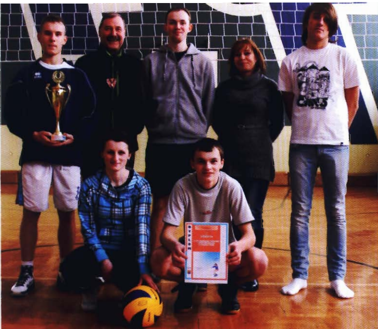
Drużyna z Łęczan - zwycięzcy turnieju