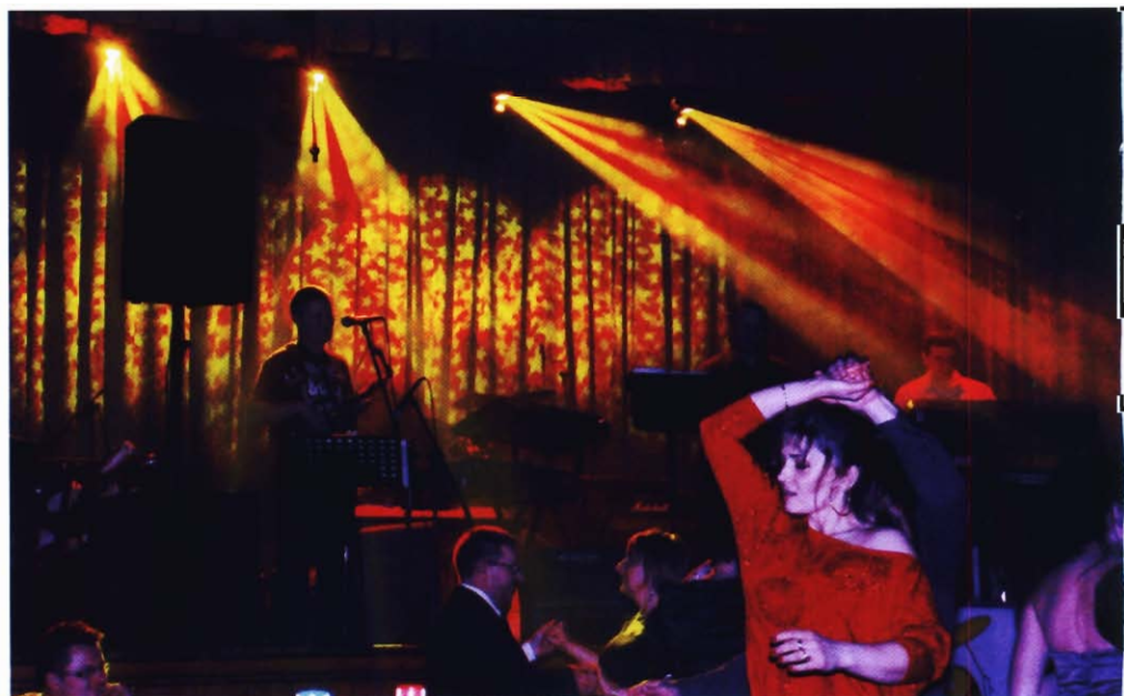
W tle zespół OSKAR