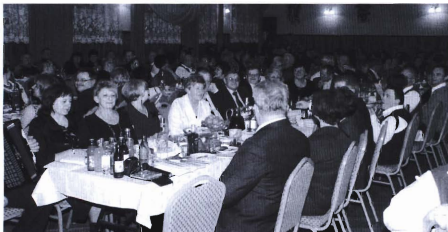
Blisko 200 osób wzięło udział w biesiadzie