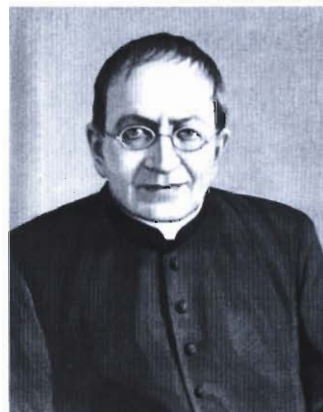
9 Senat uczcił bł. B. Markiewicza