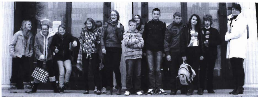
Laureaci konkursu na wycieczce w Krakowie