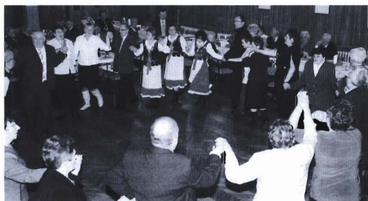
Nie tylko śpiewano, były także tańce