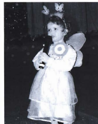
18 Najmłodszy na balach