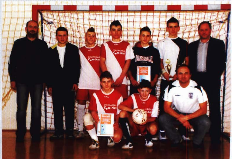
„Piast” Miejsce Piastowe - zwycięzcy w kat. gimnazjum