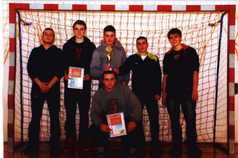
„Są Gorsi” - zwycięzcy w kat. szkoła ponadgimnazjalna