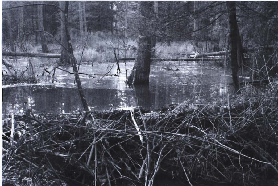
W ubiegłym roku w lesie w Zalesiu bobry zrobiły wielkie rozlewisko

Przed wszystkim, budując tamy i zmieniając stosunki wodne, zwierzęta te kształtują sobie warunki do życia. Powodują przy tym szkody w uprawach leśnych i zadrzewieniach. Aby zapewnić sobie pokarm oraz budować tamy i żeremia, ścinają nasadzenia drzew leśnych. Uciążliwą konsekwencją ich działalności mogą być również