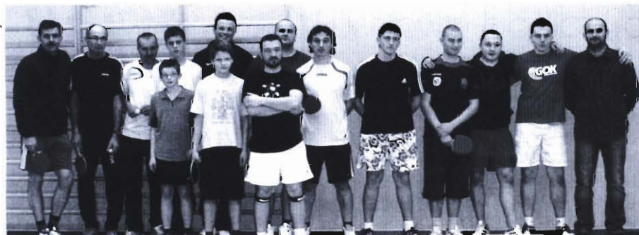
Uczestnicy rozgrywek w Szczepańcowej