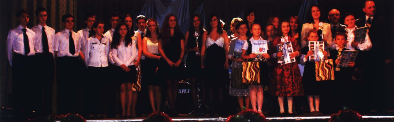
Laureaci konkursu wraz z organizatorami