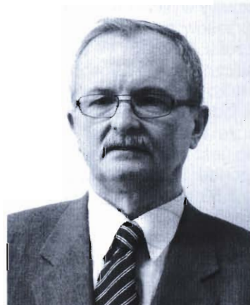
22 Nowy sołtys Wrocanki