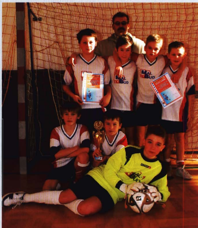
„Partyzant” Targowiska - zwycięzcy w kat. szkoła podstawowa