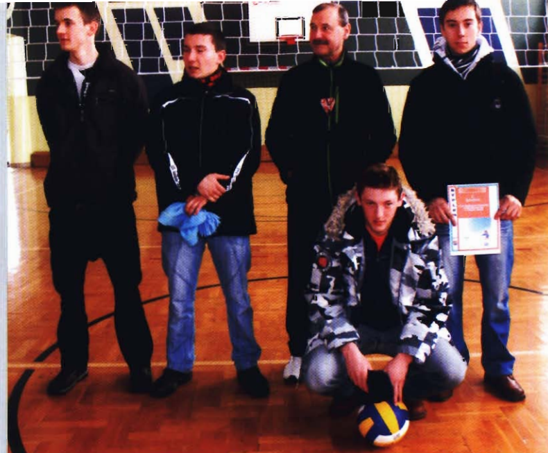
Drużyna z Miejsca Piastowego - II miejsce