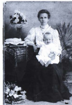
30 Na starej fotografii