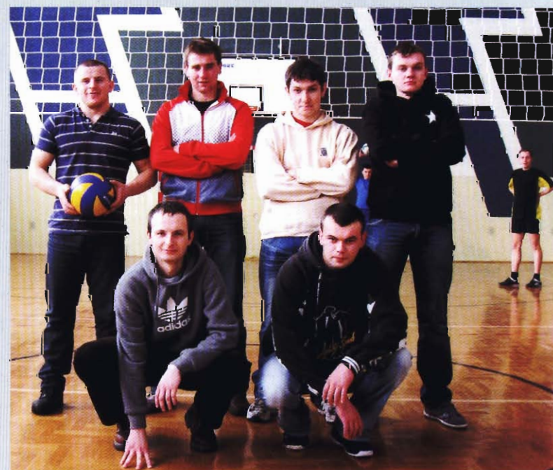
Drużyna z Głowienki - IV miejsce