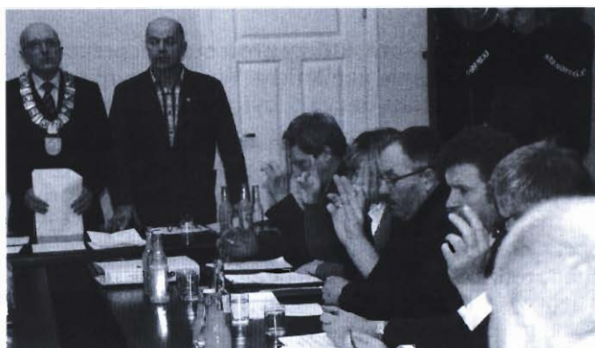
3 Zmiany w szkole w Widaczu przegłosowane