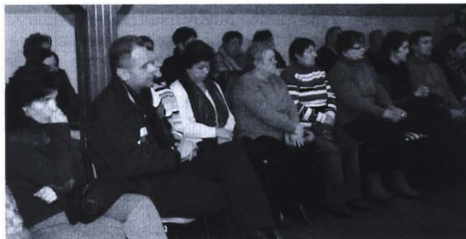
W sesji uczestniczyli mieszkańcy i nauczyciele z Widacza

zamknąć się kwotą 300 tys. zł (uwzględniając trzy etaty nauczycielskie, koszty obsługi, energii elektrycznej i ciepłej).