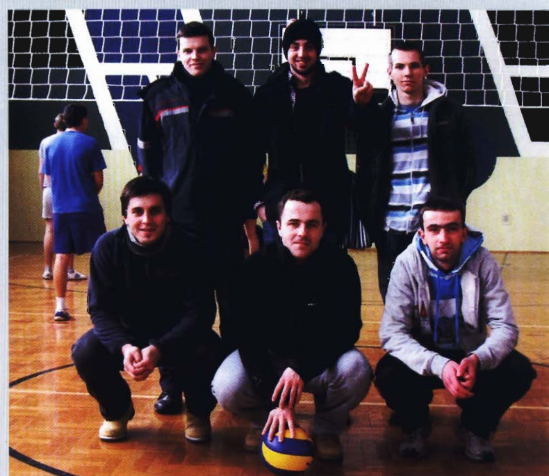
Drużyna z Wrocanki - III miejsce