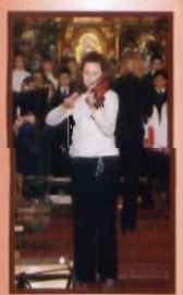
Koncert kolęd - str. 17