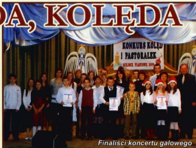
Finaliści koncertu galowego

18 stycznia 2009 r. w Gminnym Ośrodku Kultury w Miejscu Piastowym odbył się KONCERT GALOWY XI WOJEWÓDZKIEGO KONKURSU KOŁĘD I PASTORAŁEK . W koncercie wzięło udział 18 wykonawców z terenu województwa podkarpackiego, wyłonionych podczas przesłuchań, które odbyły się w dniach 14 i 15 stycznia. Łącznie w przesłuchaniach zaśpiewało ponad 70 wykonawców, którzy prezentowali się w czterech kategoriach wiekowych: do 7 lat, 7 do 10, 10 do 14, ponad 14 lat oraz w kategorii zespoły instrumentalno-wokalne.