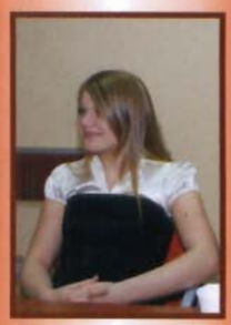
Stypendia - str. 21