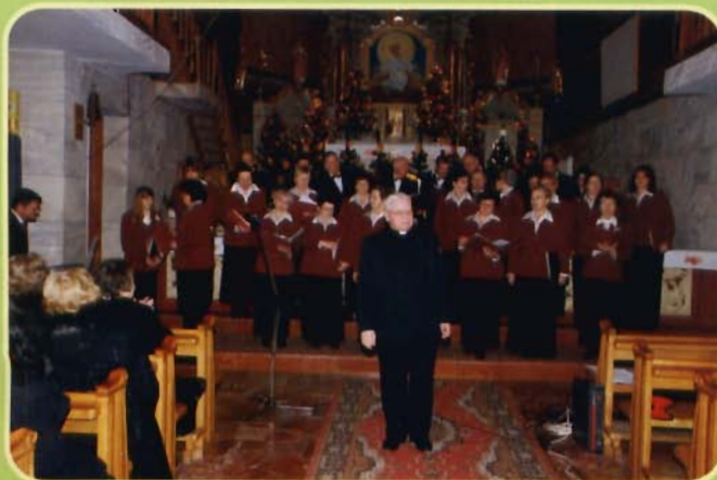
Chór Cantate z Iwonicza.