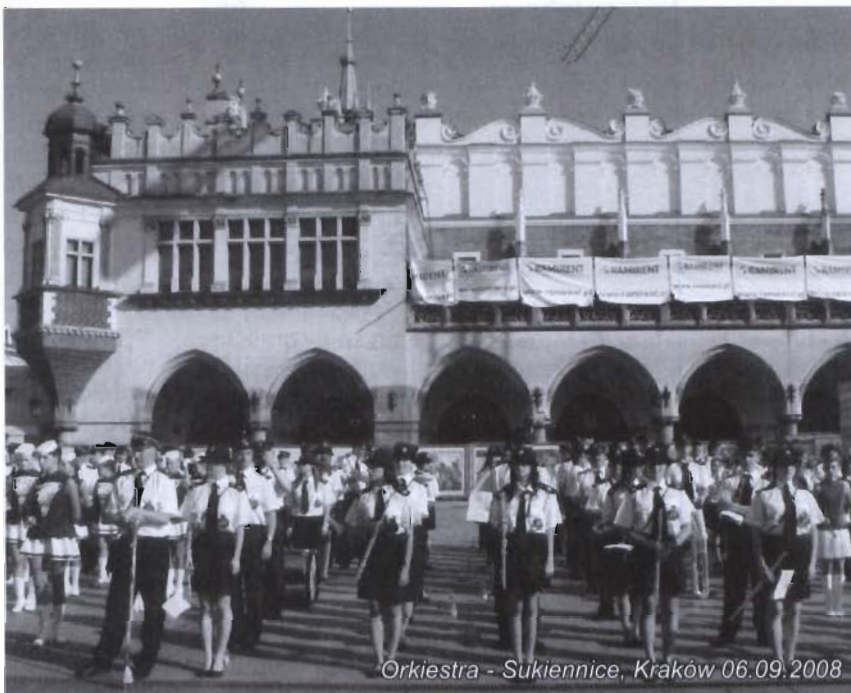
Orkiestra - Sukiennice, Kraków 06.09.2008

800 orkiestr dętych, wynik z Buska-Zdroju można z czystym sumieniem nazwać umiarkowanym krokiem naprzód i umocnieniem naszej pozycji w czołowej trzdziestce najlepszych amatorskich orkiestr dętych w Polsce.