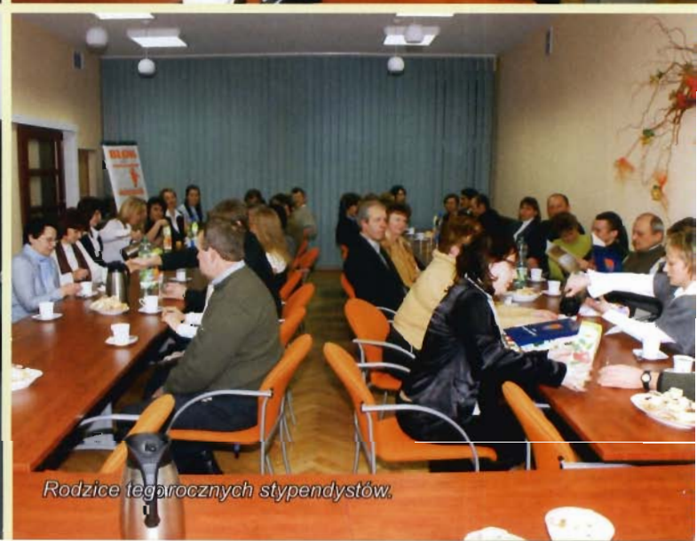
Rodzice tegorocznych stypendystów.