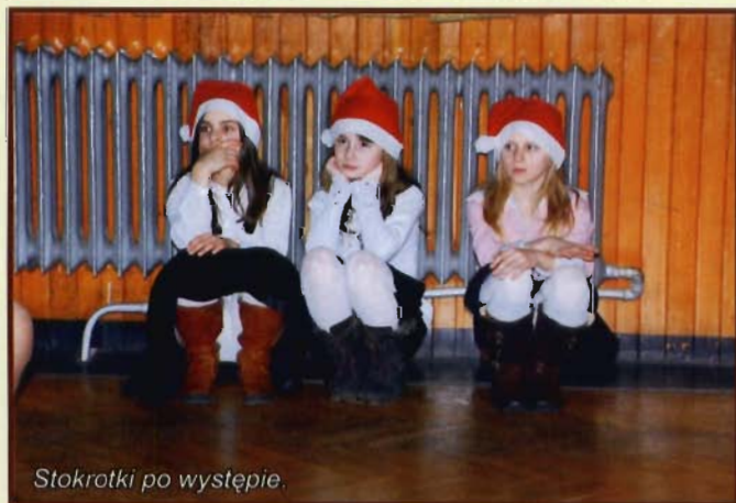
Stokrotki po występie.