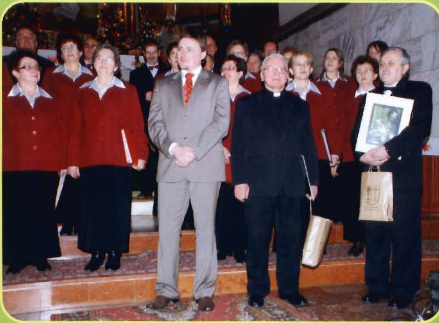
Wręczenie podziękowań dyrygentom chórów.