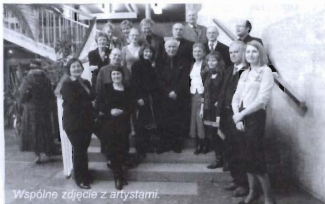
Wspólne zdjęcie z artystami.