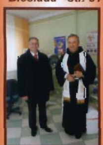
Nowe ośrodki zdrowia - str. 33