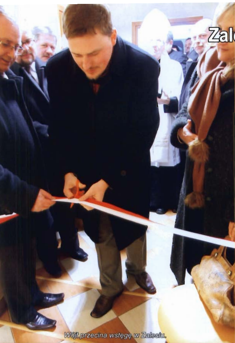
Wójt przecina wstęgę w Zalesiu.