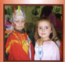
Bał w Widaczu - str. 6

MIESIĘCZNIK MIESZKAŃCÓW GMINY MIEJSCE PIASTOWE