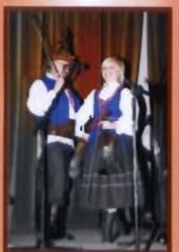
Biesiada - str. 31