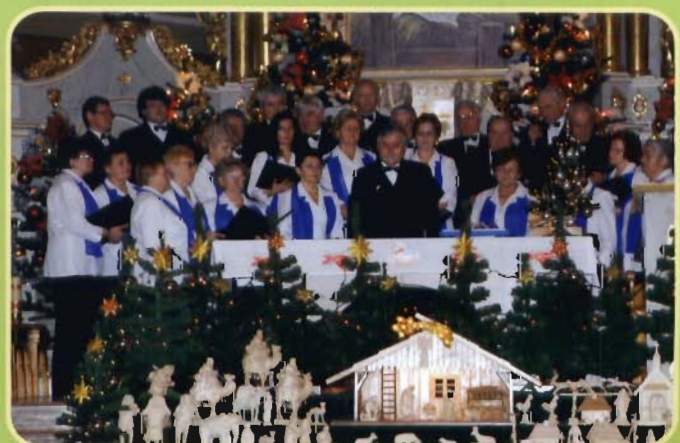
Chór Karmel ze Stropkova.