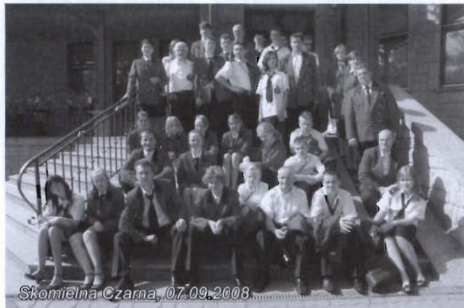
Skomielna Czarna, 07.09.2008

12 października odwiedziliśmy Częstochowę i Jasną Górę przy okazji corocznej, ogólnopolskiej pielgrzymki pracowników MPGK, na którą w tym roku zostaliśmy zaproszeni przez zarząd spółki w Krośnie.