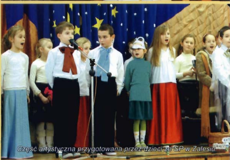
Część artystyczna przygotowana przez dzieci ze SP w Zalesiu.