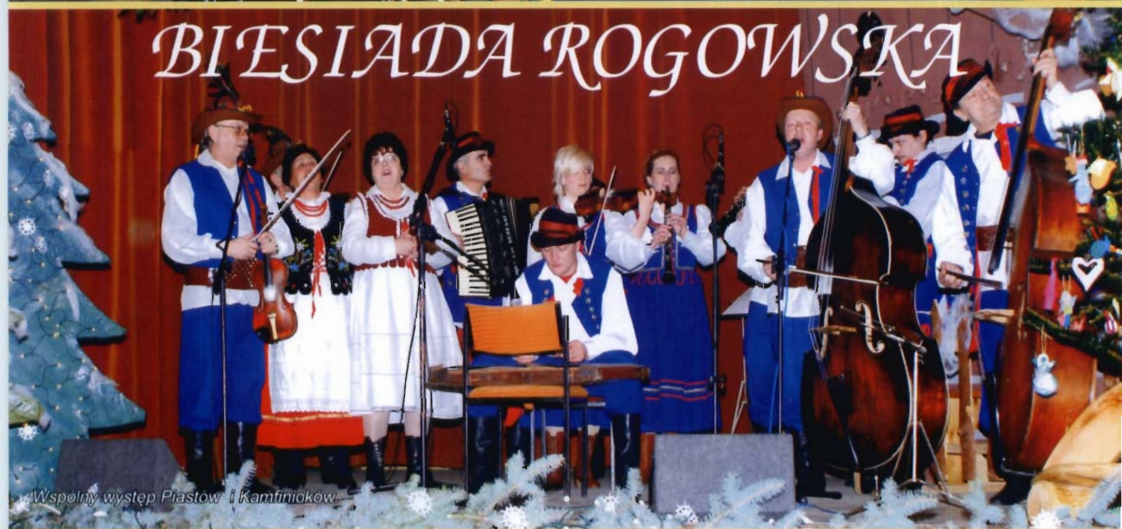
Wspólny występ Piastów i Kamfinioków.