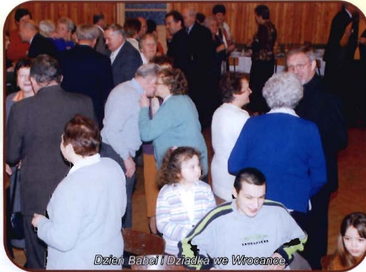
Dzień Babci i Dziadka we Wrocance