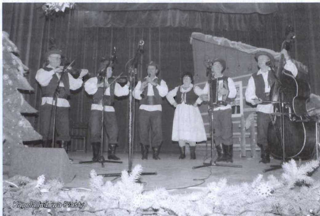
Kapela Irdowa Piasty

uczestników pamiętkowe, drewniane, kuchenne łąpatki do patelni. Wszyscy uczestnicy, zaproszeni goście, zespoły ludowe wspólnie biesiadowali za stołem, w ciepłej, miłej i serdecznej atmosferze. W tym miejscu pozwolę sobie podziękować organizatorom tegorocznej biesiady w imieniu wszystkich uczestników. Wyjątkowy klimat imprezy dopełnił piękny, jaśniejący setkami światełek, karnawałowy wystrój sali. Było naprawdę pięknie i wesoło.