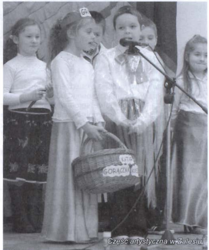
Część artystyczna w Zalesiu.